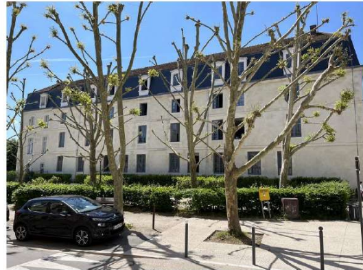
BÂTIMENT B ÉTAT AVANT TRAVAUX