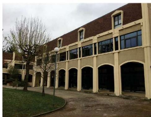
BÂTIMENT J ÉTAT APRES TRAVAUX