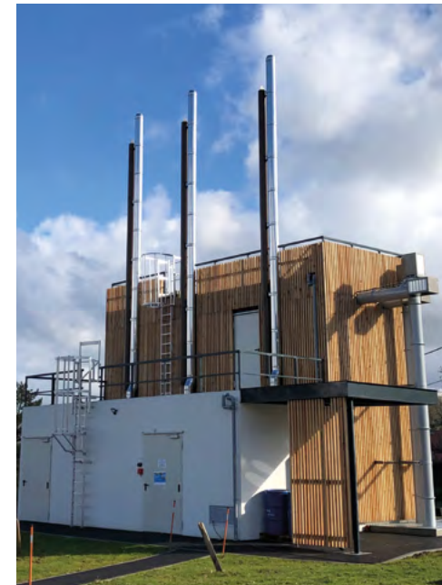
Chaudière bois EHPAD de Mamirolle (Doubs)

Leurs coordonnées par territoire d'action sont disponibles page suivante.