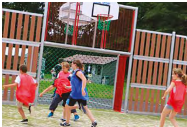
Création de zones de rencontres à Lachapelle-Sous-Rougemont (Territoire de Belfort)

Vous pouvez déposer vos dossiers toute l'année. Un comité d'engagement sélectionnera les projets proposés aux élus régionaux. Il se réunit environ toutes les six semaines.