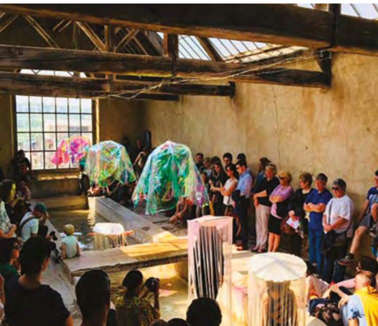
Promenons-nous dans les Arts à Passy (Yonne)