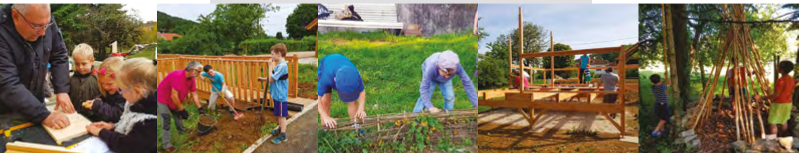
Aménagement et animation d'une aire de jeux à Rurey (Doubs)

Présidente de la Région Bourgogne-Franche-Comté